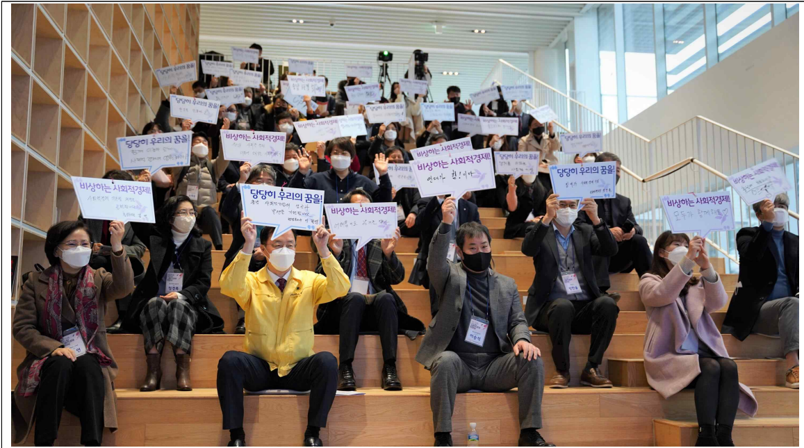
충남 사회적경제를 응원하는 행사 참석자

곳은 날씨에도 불구하고 많은 사회적경제인들이 행사장을 찾은 모습을 볼 수 있었다. 코로나 19로 인한 어려움 속에서도, 사회적가치 실현을 위해 노력하는 충남사회적경제인들을 응원함과 동시에 종사자들의 노고를 위안하여 서로 하나되는 뜻 깊은 자리가 마련된 것이다.