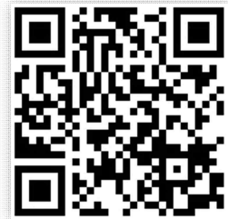
사업설명회 접속 QR