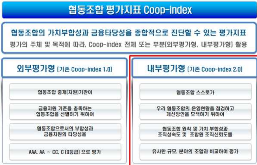
< Coop-index 내부평가형 및 외부평가형 비교 >

* 본 공고는 '내부평가형'(기존 Coop-index 2.0)의 측정 및 진단 관련임