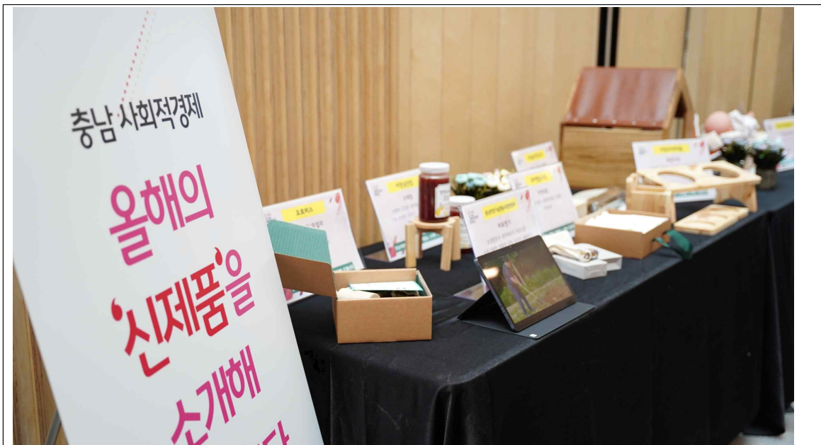
홍보부스 : 충남 사회적경제 올해의 '신제품' 소개

특히 충남 사회적경제신제품은 구성에 있어서, 지역특산물을 활용한 가공식품, 적정기술 제품, 소품, 리사이클링 제품 등 사회적경제가 추구하고 있는 환경과 사람, 상생과 협력의 결과물로서 많은 이들의 관심을 받았다. 이번 한해 사회적경제 현장에서 취재한 경험에 비추어 봤을 때, 본 행사의 의미가 깊게 다가왔다.