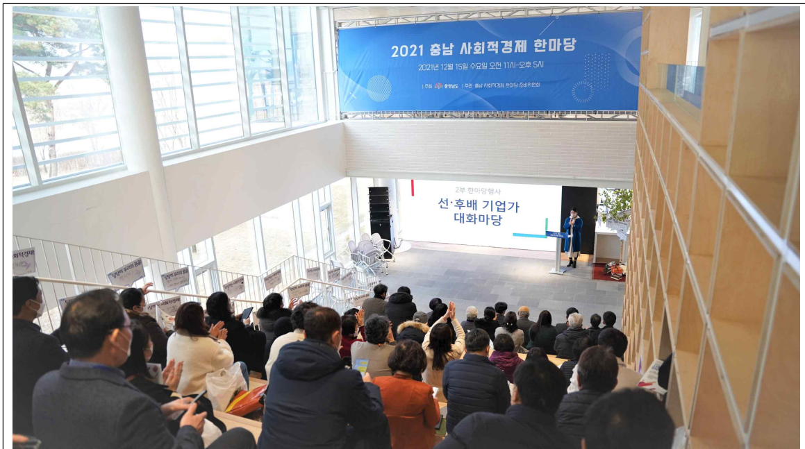
제2부 선후배 기업가 대화마당

청양사회경제네트워크와 천사연의 우수사례 공유는 현장에 참석한 많은 사회적경제인들에게 공감과 사회적경제의 방향성에 대해 다시 한번 되새기는 계기가 되었고, 우수사례 소개 후 권역별 선후배 기업인 간의 대화마당이 진행되었다.