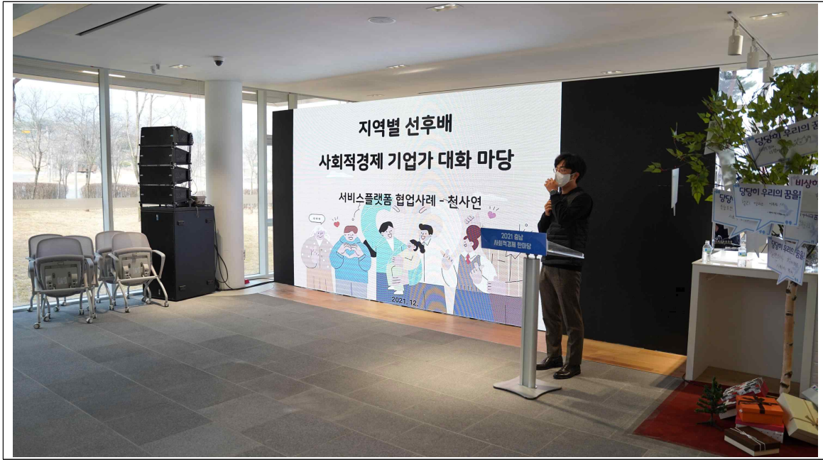
우수사례 발표 : 천사연(천안사회경제연대) '서비스플랫폼 협업사례'

청양사회경제네트워크와 천사연의 우수사례 공유는 현장에 참석한 많은 사회적경제인들에게 공감과 사회적경제의 방향성에 대해 다시 한번 되새기는 계기가 되었고, 우수사례 소개 후 권역별 선후배 기업인 간의 대화마당이 진행되었다.