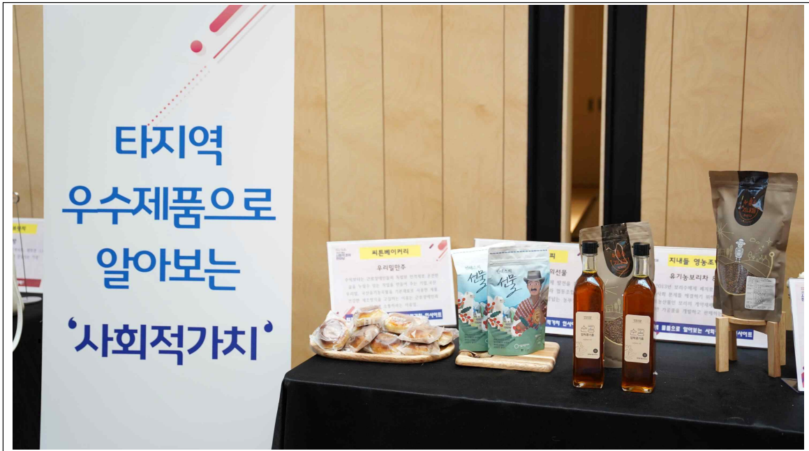
홍보부스 : 타 지역 우수제품으로 알아보는 '사회적가치'

특히 충남 사회적경제신제품은 구성에 있어서, 지역특산물을 활용한 가공식품, 적정기술 제품, 소품, 리사이클링 제품 등 사회적경제가 추구하고 있는 환경과 사람, 상생과 협력의 결과물로서 많은 이들의 관심을 받았다. 이번 한해 사회적경제 현장에서 취재한 경험에 비추어 봤을 때, 본 행사의 의미가 깊게 다가왔다.