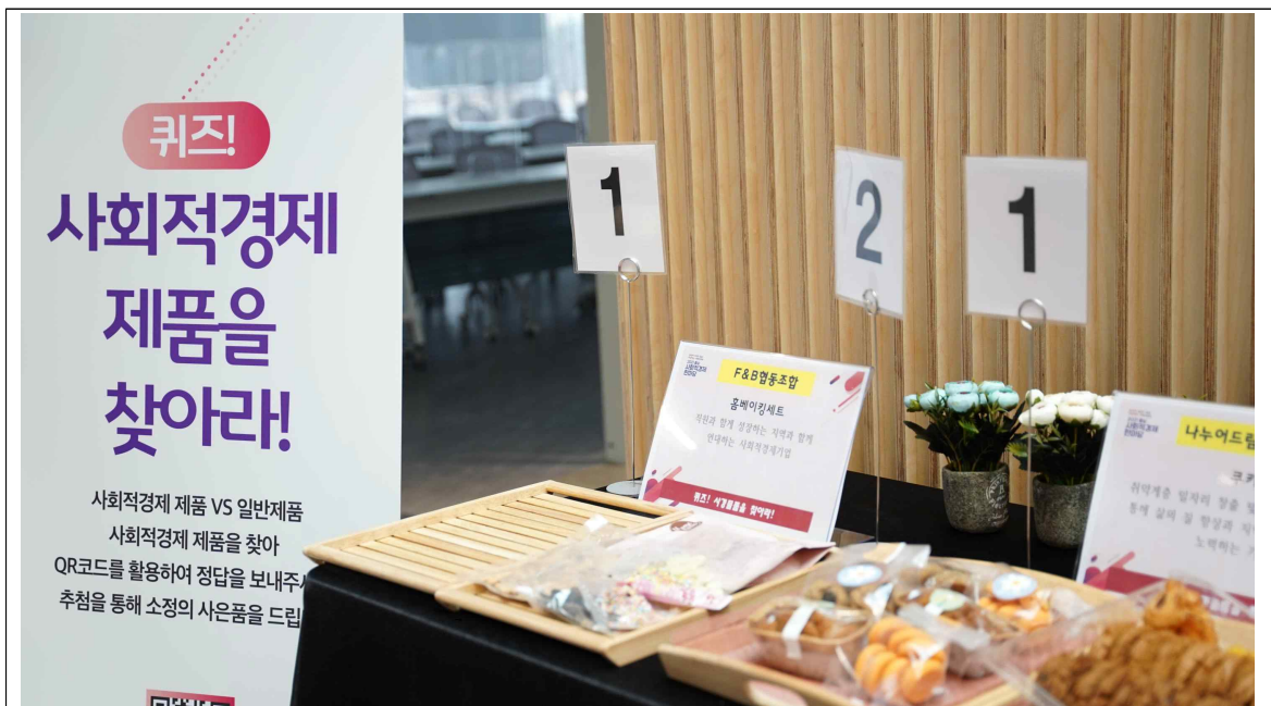
홍보부스 : 퀴즈 사회적경제제품을 찾아라

먹거리, 소품, 적정기술제품 등 다양한 제품이 각각의 사회적가치와 활용성을 보여줌으로써 흥미로움을 느낄 수 있는 전시였고, 지역의 농산물을 이용한 가공식품은 맛과 안전, 신뢰를 내세운 훌륭한 제품들로 구성되어있었다.