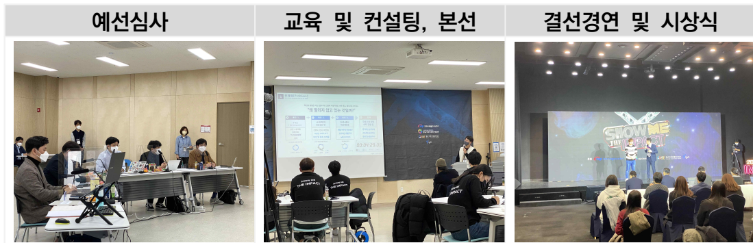
그림 4. 쇼미더임팩트 진행과정