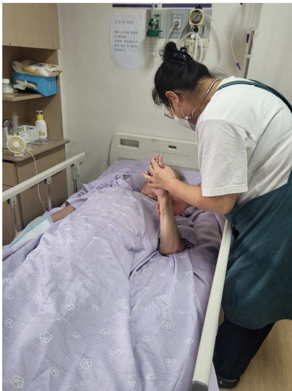
(주)위드유 요양보호사 활동1