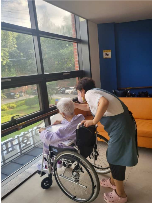
(주)위드유 영양보호사 활동3