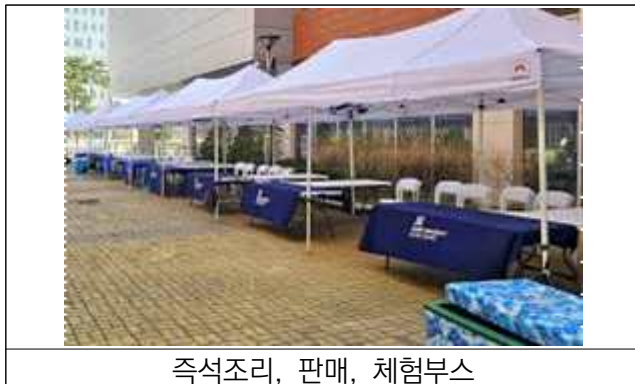
즉석조리, 판매, 체험부스