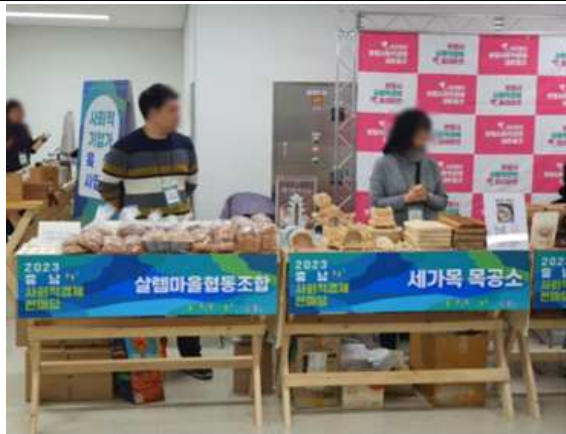
판매존 매대 예시