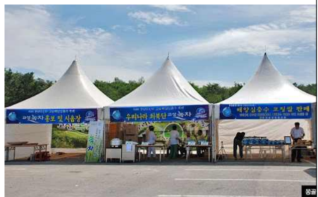
체험 판매 부스 예시